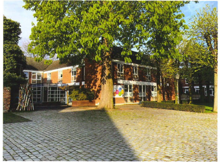
Das Placidahaus im Schatten des Doms.

Das BKX unterrichtet rund 370 Schülerinnen und Schüler, die zu einem großen Teil in dem zukünftigen Pastoralen Raum beheimatet sind