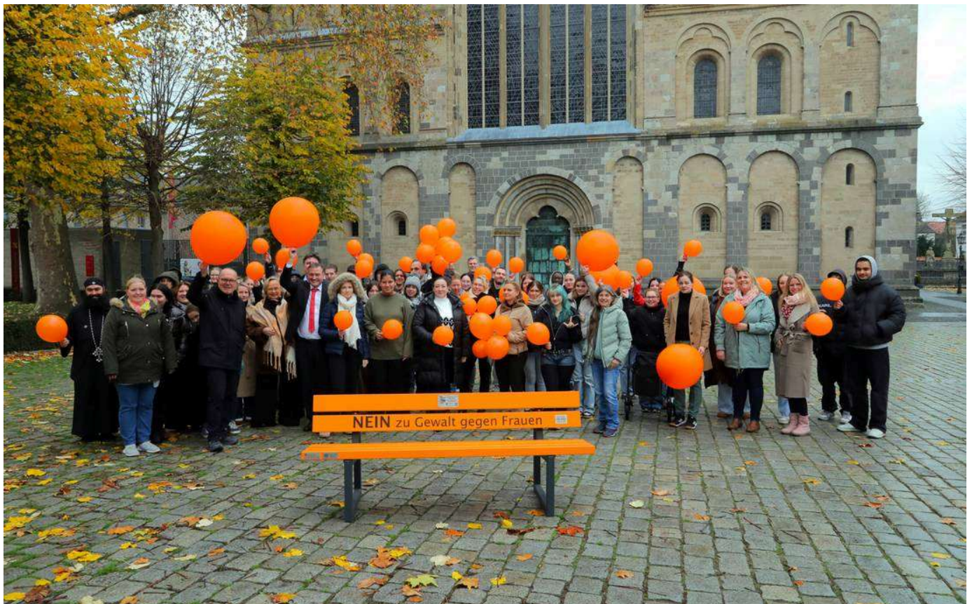
„Nein zu Gewalt gegen Frauen“: Die Schulgemeinschaft und die Unterstützer stellen die orangefarbene Bank am Placidahaus vor.

18.11.2025, 18:37 Uhr · 3 Minuten Lesezeit