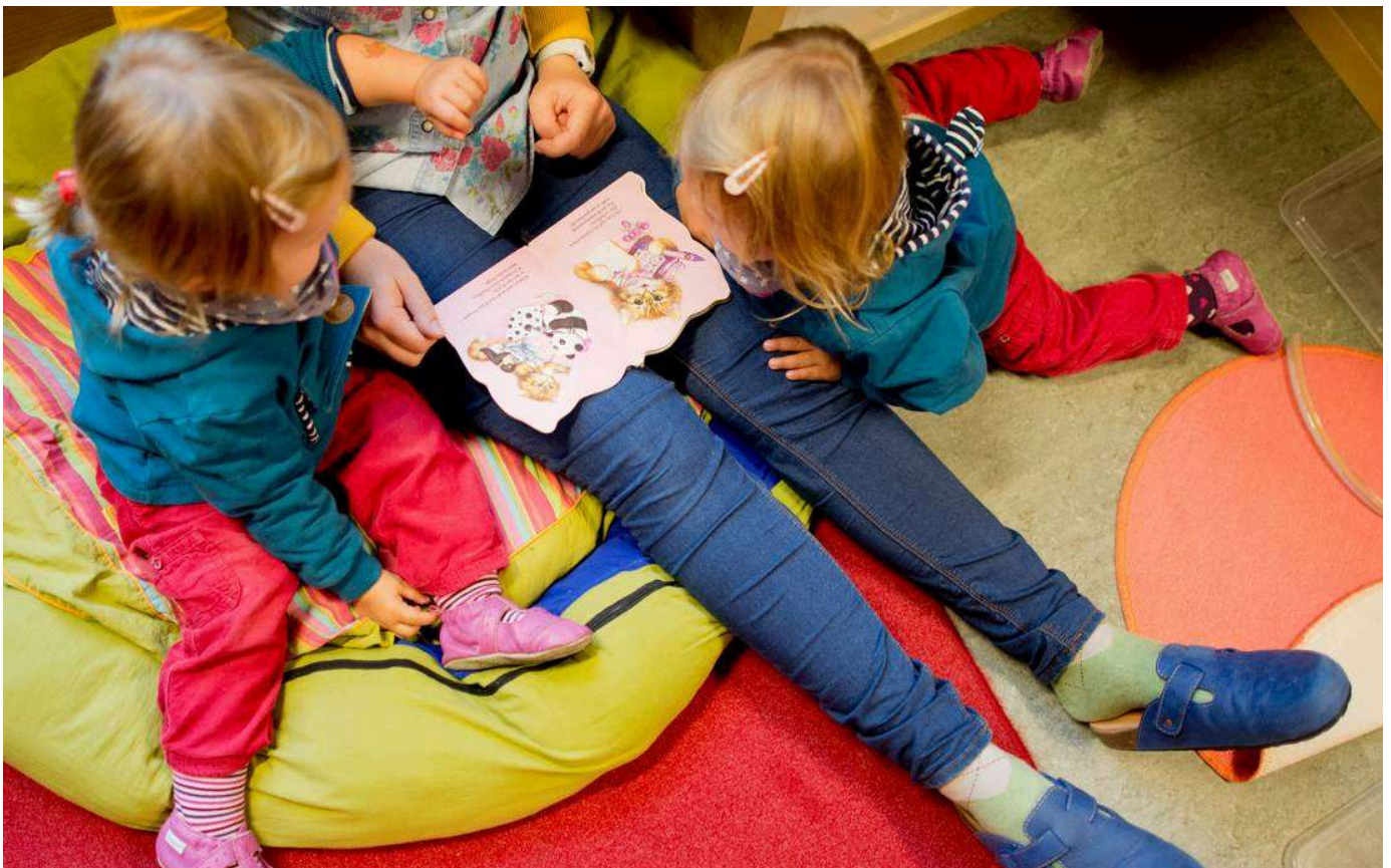
Eine Erzieherin mit Kindern in einer Kita: Der Tageskurs richtet sich an pädagogische Fachkräfte (Symbol-Foto).

24.11.2025, 15:54 Uhr · Eine Minute Lesezeit