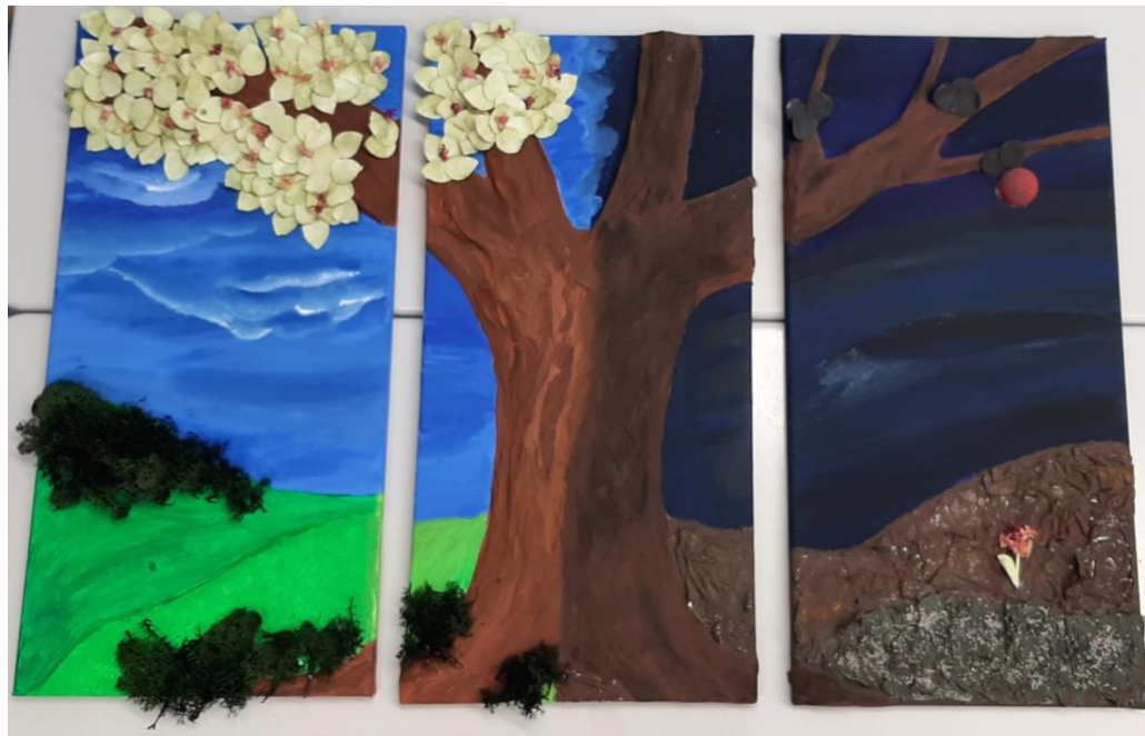
Da berühren sich Himmel und Erde